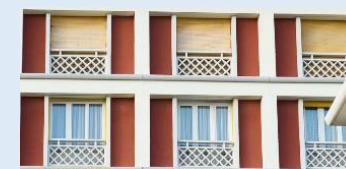
Sortie au Havre